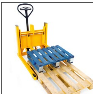
Παραλαβή μιας παλέτας 1/2 από μια στάνταρ ευρωπαϊκά